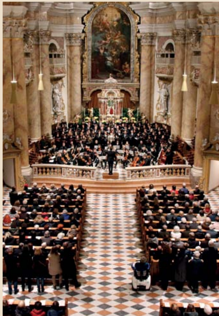
Cäcilienkonzert der Kantorei Leonhard Lechner am 24. November 2019.