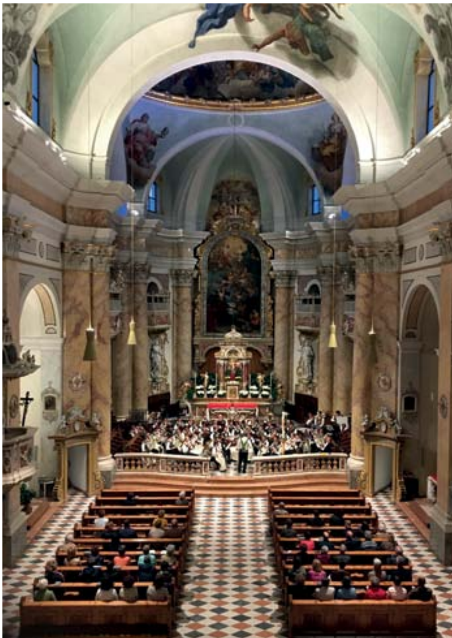
Konzert der Bürgerkapelle Gries am 10. Mai 2019.